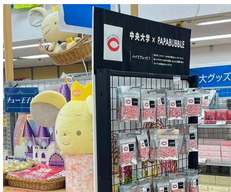
生協の中大グッズコーナーには新商品も登場しています。

生協でさまざまな中大グッズを購入しようとしてジに列をなしている様子も微笑ましいものです(グッズに関心のある方は、「中央大学マーク入りグッズ」で検索してみてください)。